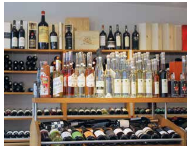
Das Sortiment umfasst mehr als 500 Weine – dazu kommen 40 Schaumweine und eine beachtliche Auswahl an Spirituosen.

führerin angeboten. Generell stellt Klaus Grüninger-Fey fest: „Eine Weinprobe ist keine reine Verkaufsveranstaltung, sie muss sich auch selbst finanziell tragen.“ Sie diene vor allem der Bindung von Stammkun-